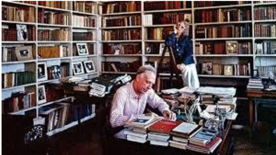
Adolfo Bioy Casares. (Buenos Aires, 15 de septiembre de 1914 - 8 de marzo de 1999).

Su carrera literaria empieza muy pronto, al publicar la novela La invención de Morel en 1941 y obtener así el Premio Municipal de Literatura de la Ciudad de Buenos Aires, entre otros premios relevantes.