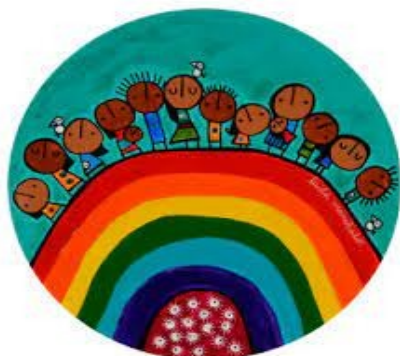
Imagen: Lucila Manchado