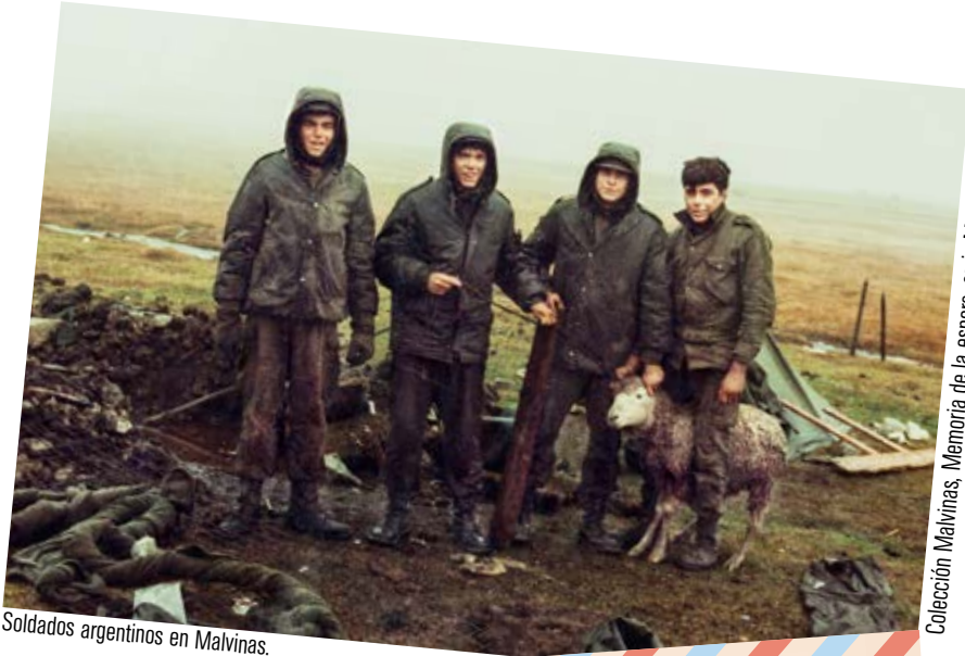
Soldados argentinos en Malvinas.

Colección Malvinas, Memoria de la espera, serie Martín Borba.