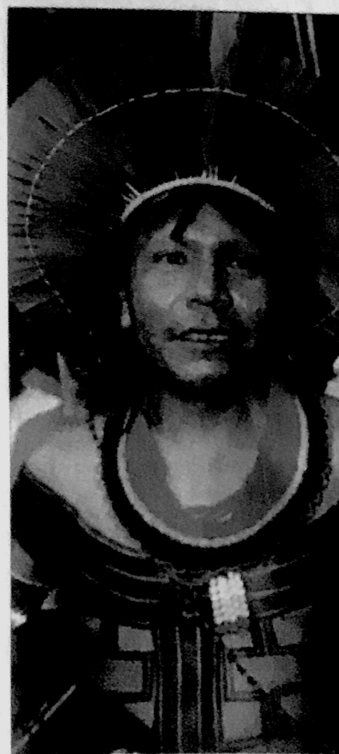
El músico Sting durante la selva amazónica.

ra satisfacer las prop cidieron convocar la y el Desarrollo, conc