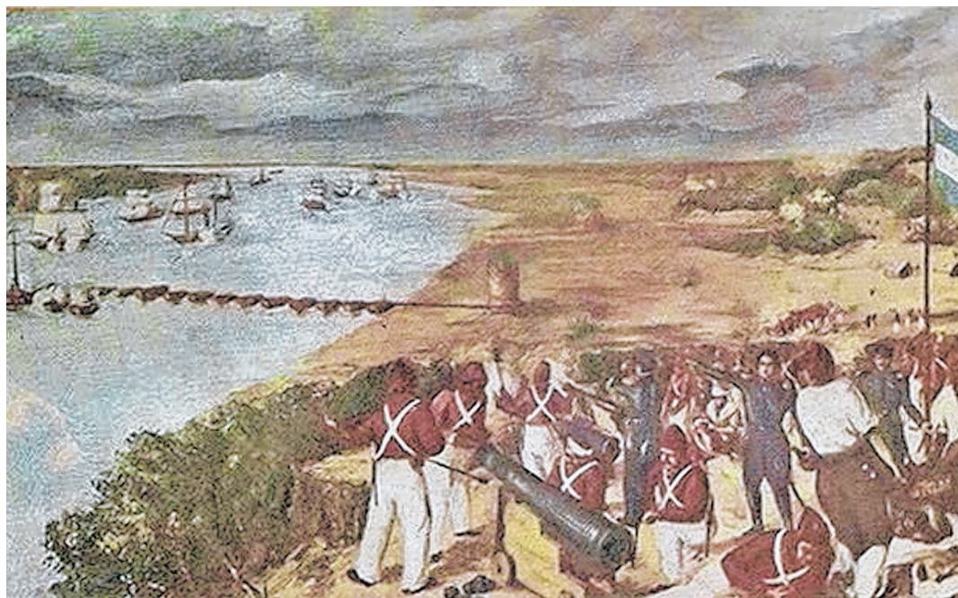
Batalla Vuelta de Obligado.

En noviembre de 1845, con Juan Manuel de Rosas como responsable de las relaciones exteriores del territorio nacional, las tropas anglofrancesas comenzaron a remontar el río Paraná, con un importante conjunto de navíos: el 20 de noviembre, en un sitio donde el río tuerce su curso, conocido como la Vuelta de Obligado, cerca de San Pedro, los soldados a cargo del General Lucio N. Mansilla- cuñado de Rosas, y padre de Lucio V. Mansilla- aguardaban al invasor. Se trató de una batalla desigual, en la que el ingenio local, a pesar de encontrarse en inferioridad de condiciones tanto de navíos como de municiones, dio en disponer de costa a costa una serie de barcos "acorderados", unidos por cadenas,