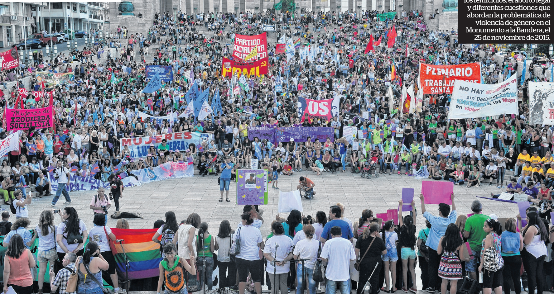
VIRGINIA BENEDETTO / LA CAPITAL