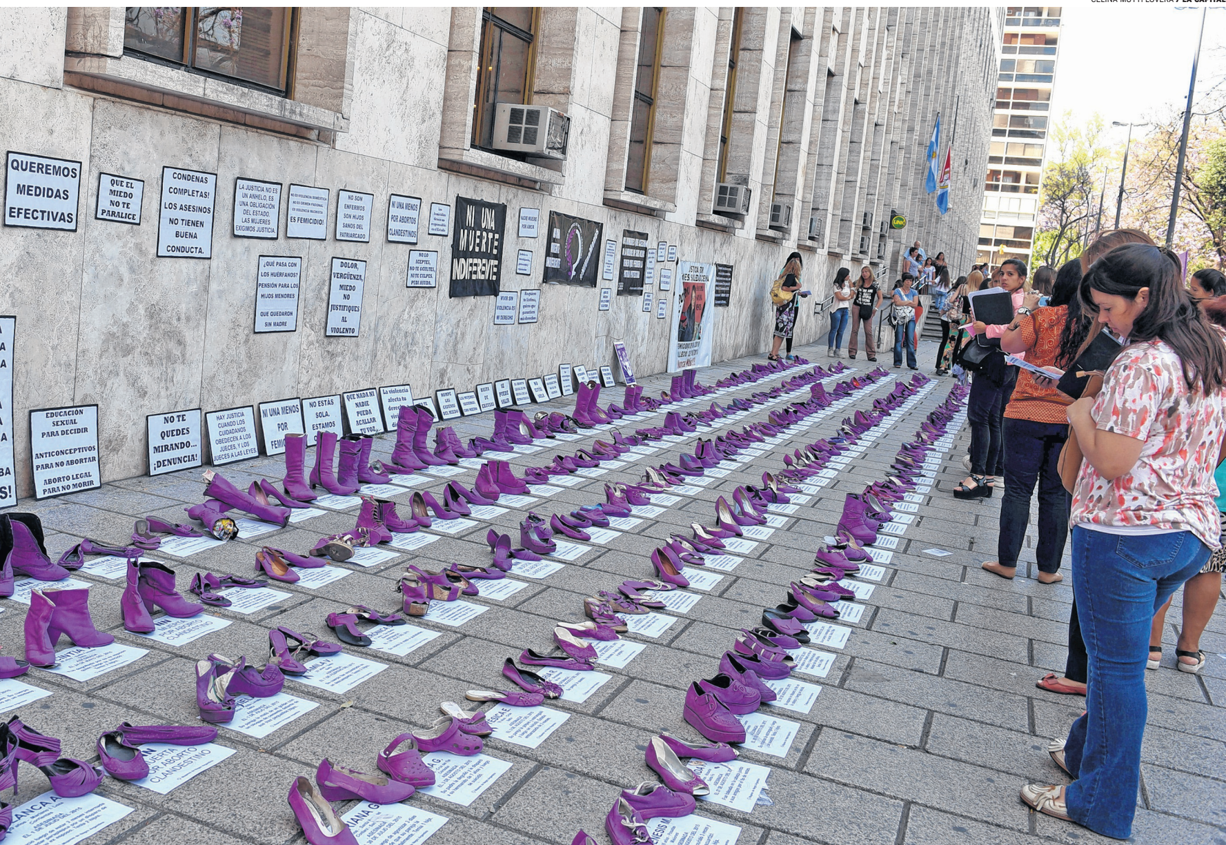
ZAPATOS VIOLETAS. En noviembre de 2015 las organizaciones de mujeres se concentraron en Tribunales para exigir justicia.